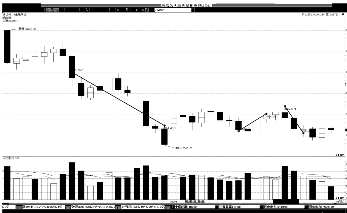
图表 2: 交易情况