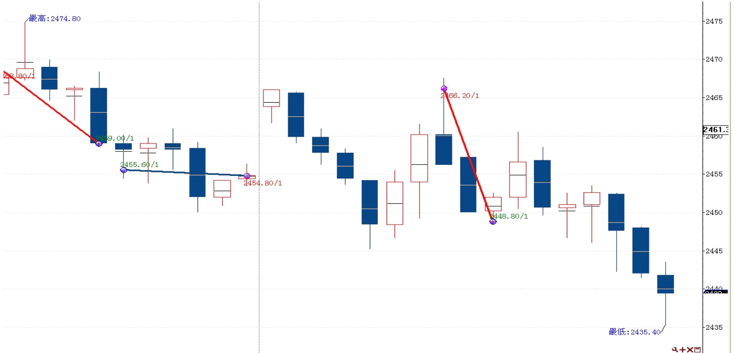
图表 2: 交易情况