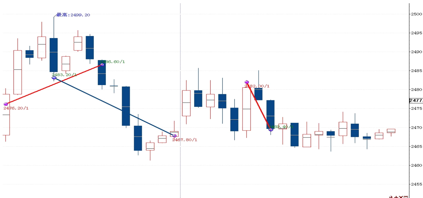
图表 2: 交易情况