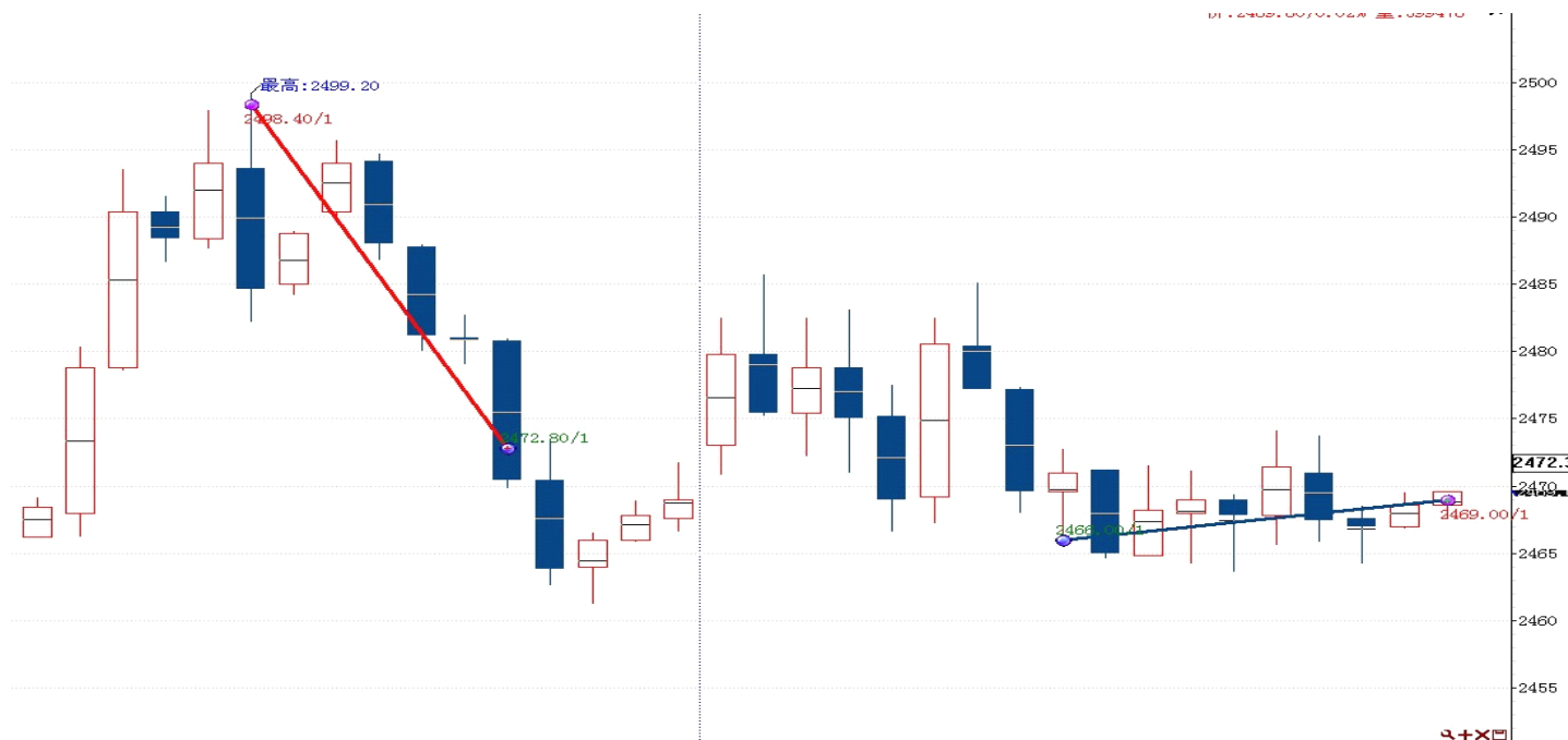
图表 2: 交易情况