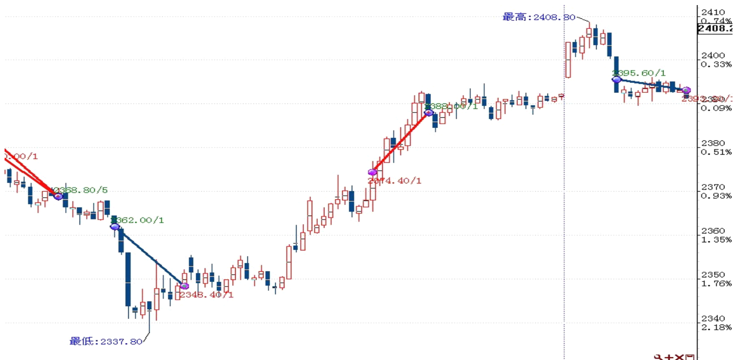
图表 2: 交易情况