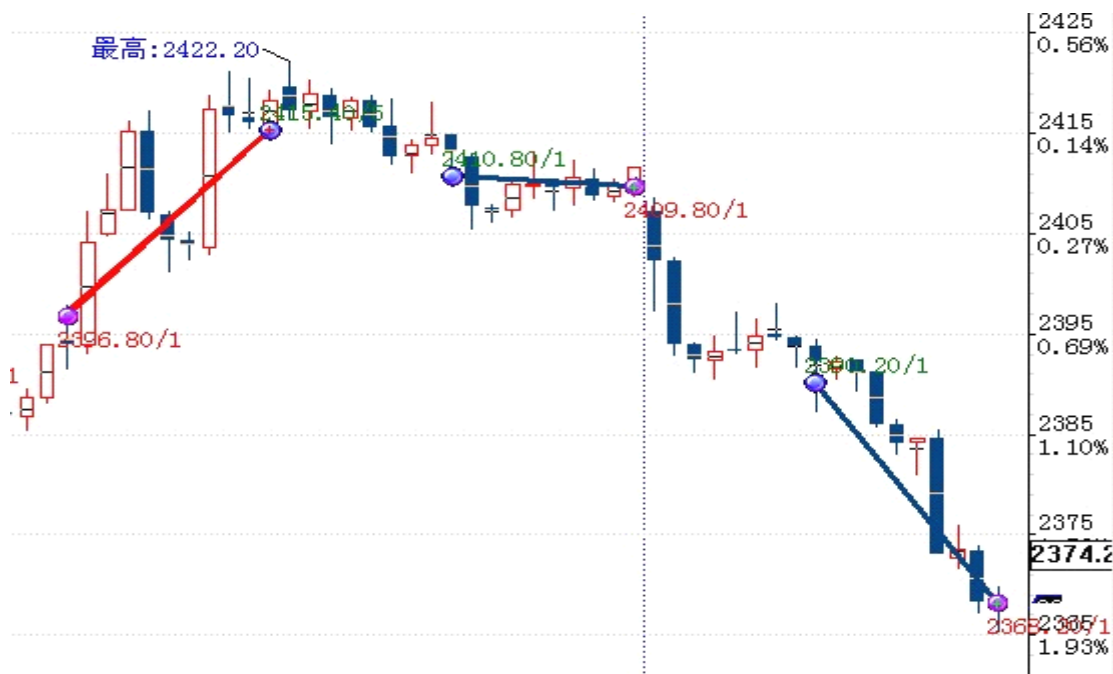
图表 2: 交易情况