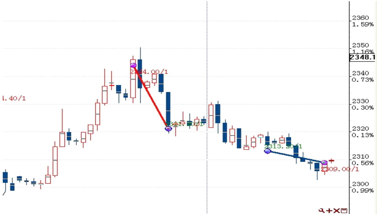
图表 2: 交易情况