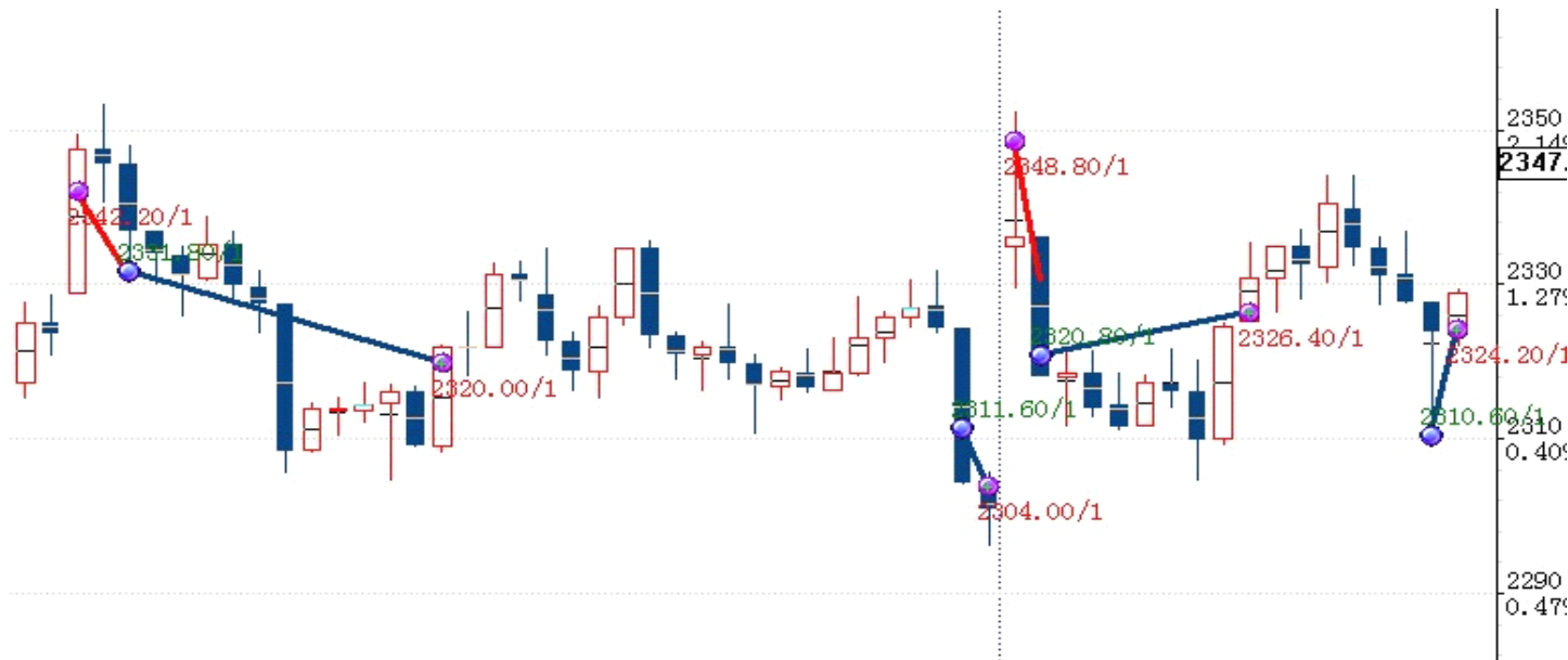
图表 2: 交易情况