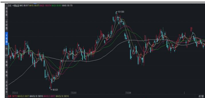
图 3.三大期债持仓量变化