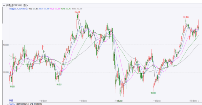
图 2. 国债期货 10 年期日 K 线图

金融市场风险偏好下降，股债跷跷板效应显现，国债期货高位偏强运行，全周来看，30 年期主力合约本周涨 0.81%，10 年期主力合约周涨 0.56%，5 年期主力合约周涨 0.29%，2 年期主力合约周涨 0.10%。周一国债期货全线收涨，30 年期主力合约涨 0.19%，10 年期主力合约涨 0.14%，5 年期主力合约涨 0.07%，2 年期主力合约涨 0.02%；周二国债期货全线收涨，30 年期主力合约涨 0.15%，10 年期主力合约涨 0.19%，5 年期主力合约涨 0.12%，2 年期主力合约涨 0.07%；周三国债期货多数收涨，30 年期主力合约涨 0.22%，10 年期主力合约涨 0.09%，5 年期主力合约涨 0.04%，2 年期主力合约跌 0.01%；周四国债期货收盘小幅下跌，30 年期主力合约跌 0.04%，10 年期主力合约跌 0.04%，5 年期主力合约跌 0.06%，2 年期主力合约跌 0.01%；周五国债期货全线收涨，30 年期主力合约涨 0.38%，10 年期主力合约涨 0.26%，5 年期主力合约涨 0.18%，2 年期主力合约涨 0.06%。