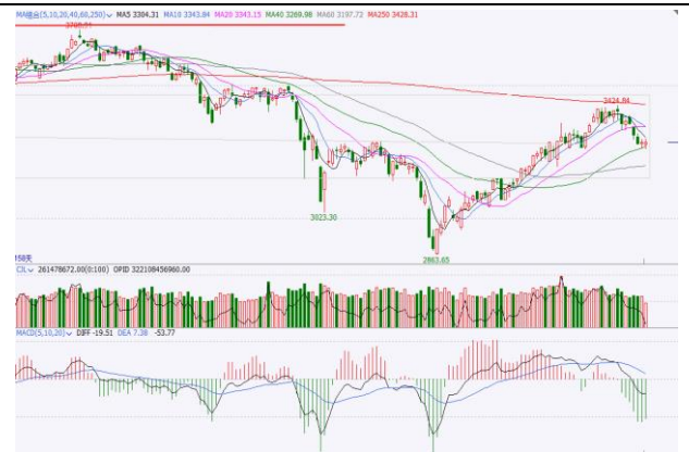
图 6.上证指数日 K 线图