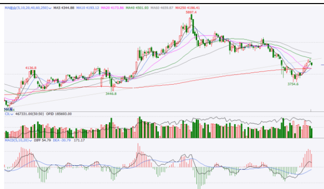
图 5. IF 加权周 K 线图

周线方面，IF加权在40周线附近遇阻回落，回补了4358-4366向上跳空缺口，成交量和持仓量下降，短期或进入阶段性调整，关注下方20周线支撑。