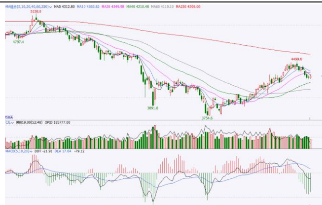
图 5.IF 加权日 K 线图