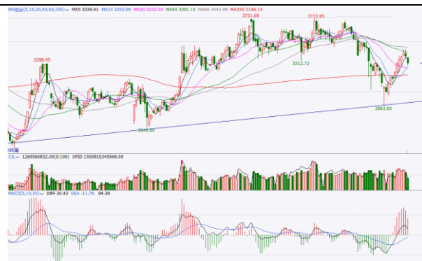
图 6. 上证指数周 K 线图