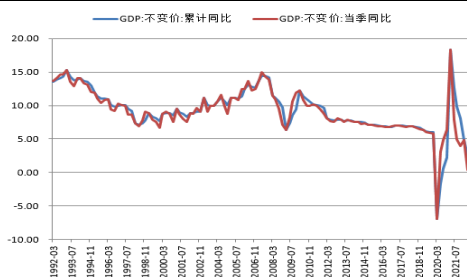
图 1. 中国第二季度 GDP 同比

沪深港通北上资金呈现净流出状态，截止2022年7月14日，沪股通资金本周累计净流出72.10亿元，深股通资金累计净流出59亿元。