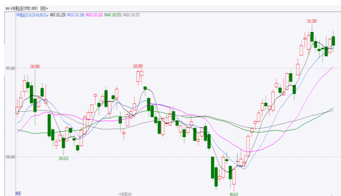
图 2.国债期货 10 年期日 K 线图

最近一周，国内 7 月出口和美国非农就业数据超预期，前期止盈需求增加，多重因素影响下期债高位回落。周一国债期货集体收跌，10 年期主力合约跌 0.05%，5 年期主力合约跌 0.06%，2 年期主力合约跌 0.04%；周二国债期货多数小幅收跌，10 年期主力合约涨 0.05%，5 年期主力合约跌 0.02%，2 年期主力合约跌 0.03%；周三国债期货多数小幅收跌，10 年期主力合约跌 0.01%，5 年期主力合约跌 0.02%，2 年期主力合约平收；周四国债期货集体收涨，10 年期主力合约涨 0.10%，5 年期主力合约涨 0.02%，2 年期主力合约涨 0.01%；周五国债期货集体小幅收跌，10 年期主力合约跌 0.01%，5 年期主力合约跌 0.02%，2 年期主力合约跌 0.01%。